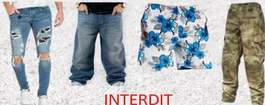
Vêtements troués, délavés, cloutés, bariolés...