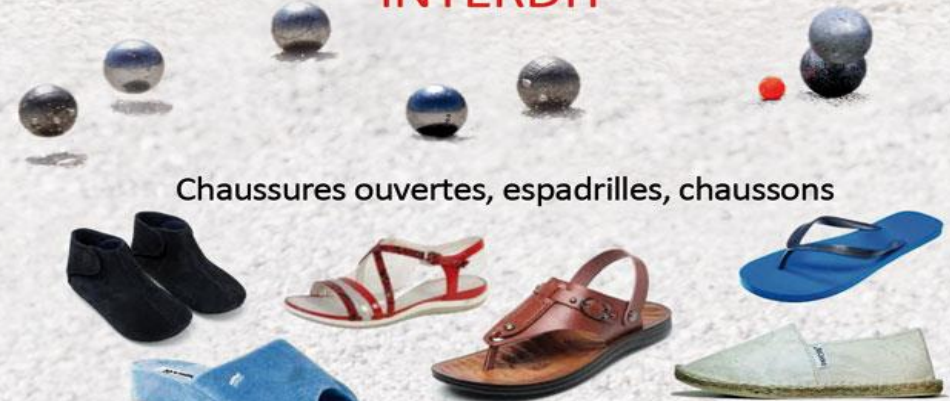
Chaussures ouvertes, espadrilles, chaussons