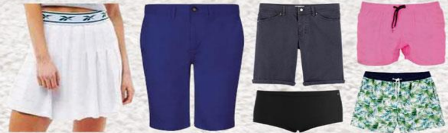
Shorts de bain, jupe, robe, bermudas de ville...