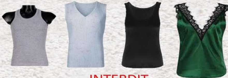
Débardeurs, marcel, chemisiers sans manche